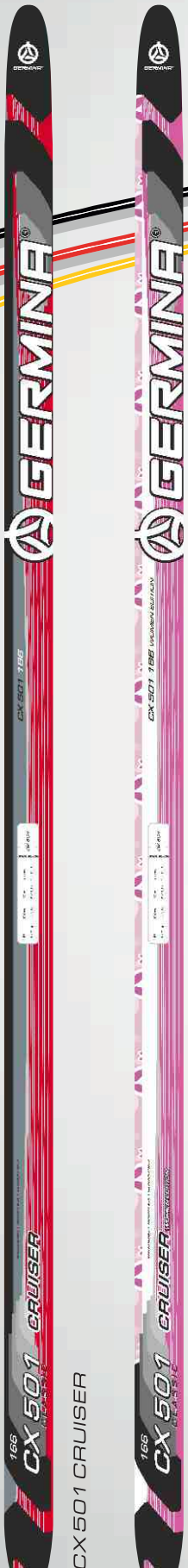
CX 501 CRUISER