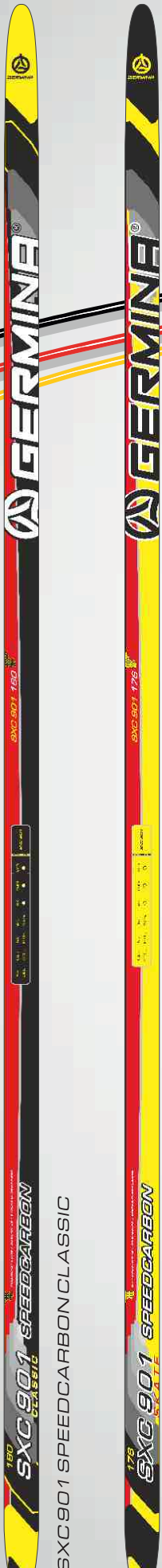
SXC 901 SPEEDCARBONCLASSIC